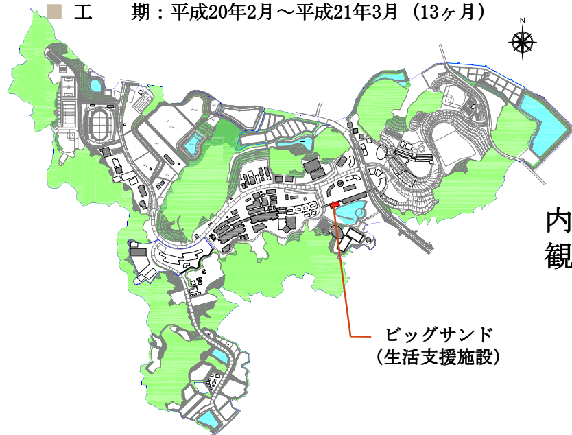
ビッグサンド （生活支援施設）