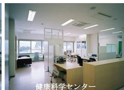
健康科学センター