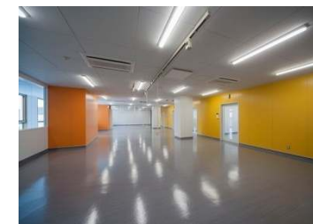
3階材料物理実験室