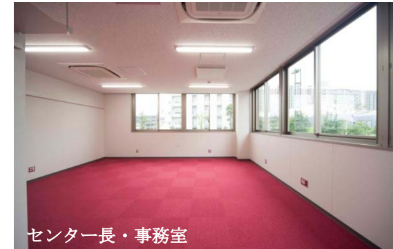
センター長・事務室