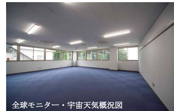
全球モニター・宇宙天気概況図