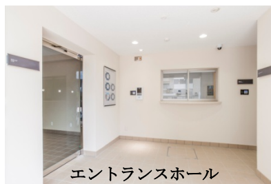
エントランスホール