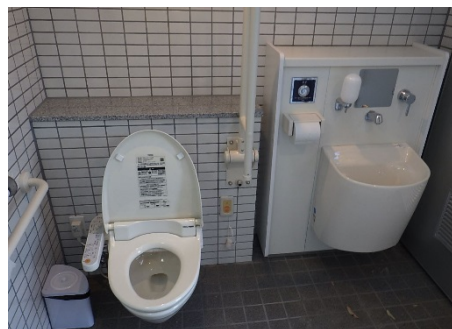
多目的トイレ (オストメイト対応)