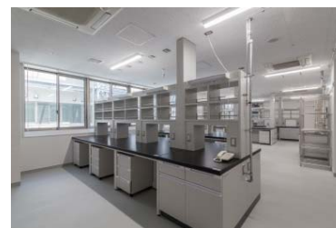
分子遺伝学実験室