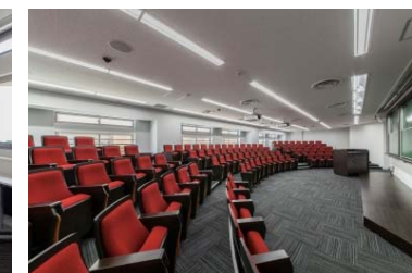
IMIオーデイドリウム